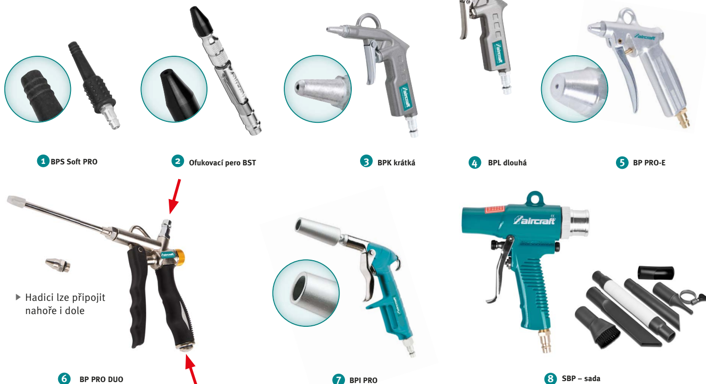
1 BPS Soft PRO