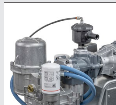
Jednoduchá údržba po demontování krytu