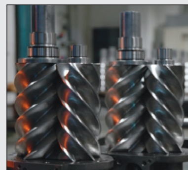
Spolehlivý a efektivní šroubový blok C43