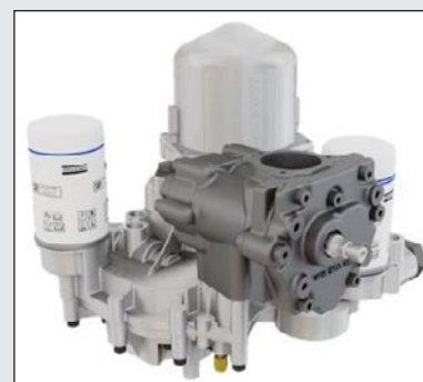
Inovativní šroubový blok C43i přímo spojený s motorem