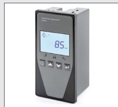
Elektronická jednotka Infologic 2 ve standardu

SPL-22/10D-500 22 kW, vzdušník 500 litrů