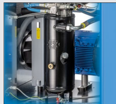
Vertikální vysoce účinná třístupňová separace oleje