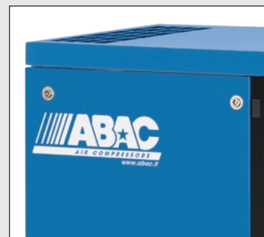
Demontovatelné panely pro snadnou a rychlou údržbu kompresoru