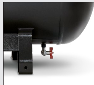
Kulový kohout pro snadné odpouštění kondenzátu