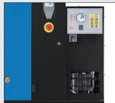
Sušička s ekologickým chladičem R513A