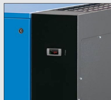
Kondenzační sušička s indikátorem rosného bodu s ekologickým chladivem R410A